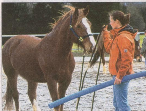
Bodenarbeit ist die wichtigste Grundlage für den richtigen Umgang mit Pferden.

Infos: Zentrum Pferdepunkt, Claudia Meier, Breitenfeld 66, D-79761 Waldshut-Tiengen. Tel. 0049 7741 80 90 18. Mobile: 0049 151 105 759 31 mail@pferdepunkt.com www.pferdepunkt.com