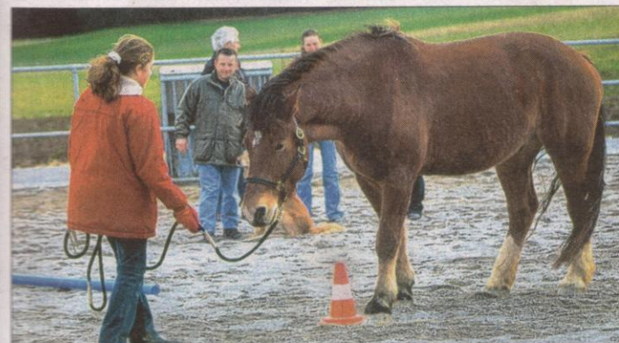
Spielerische Übungen sind immer eine willkommene Abwechslung.