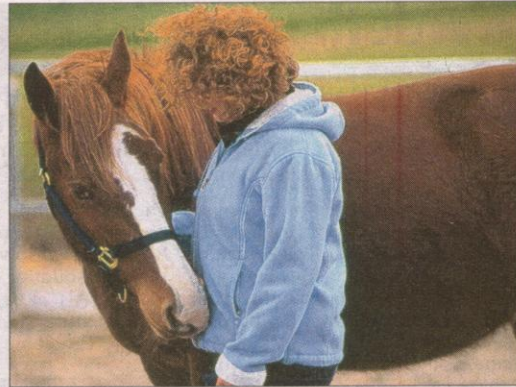
Mit den ausgeglichenen Pferden stellen die Seminarteilnehmer schnell einen Kontakt her.

rechte Haltung, Fütterung und Betreuung der Tiere sind bestens gewährleistet. Die grossen Auslaufboxen bieten den Pferden viel Licht, Luft und Bewegung sowie die Möglichkeit, mit den Nachbarn sozialen Kontakt aufzunehmen. Der Gruppenstall mit anliegender Eingliederungsbox und befestigtem Auslauf fördert die Kontakte der Pferde untereinander und zwischen Mensch und Pferd. Zur Anlage gehören eine grosse, von Tageslicht durchflutete Reithalle, ein Aussenplatz, ein Round Pen und